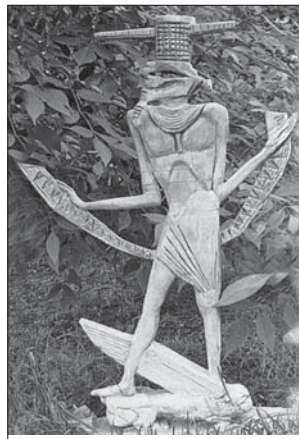
В. Жуковський. «Халді». 1998. Дерево, різьблення

демію образотвор. мист-ва і арх-ри (Київ, 1999; майстерня В. Шевцова ). Осн. галузі: монум. скульптура та живопис. На твор. роботі. Учасник мист. виставок від кін. 1990-х рр. Персон. – у Києві (1998–99, 2001, 2009), Москві (2004). У стилі експресив. реалізму створює образи-фентезі, композиції, портрети. ( Див. іл. на с. 282 ).